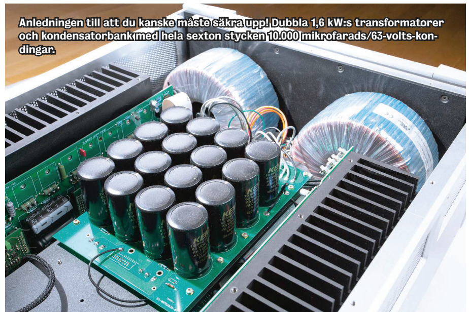
Anledningen till att du kanske måste säkra upp! Dubbla 1,6 kW:s transformatorer och kondensatorbank med hela sexton stycken 10.000 mikrofaraads/63-volts-kondingar.

Med högupplösta högtalare av Vivids kaliber blev det verkligen påtagligt med vilken finstilt millimeterprecision Oden kunde fixera sångare och instrument djupt in i