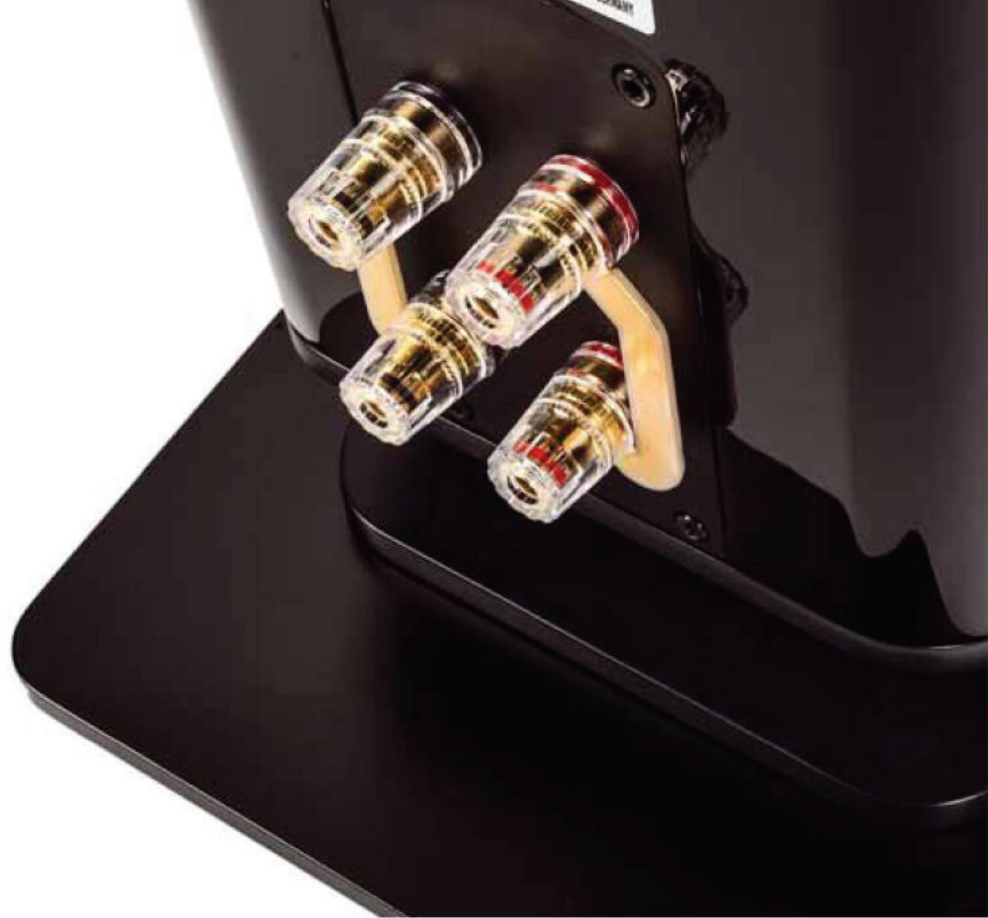
Solide Bi-Wiring-Terminals sorgen für den korrekten Anschluss aller erdenklichen Lautsprecherkabel

Und etwas Ähnliches lässt sich auch über den akustischen Auftritt sagen: Die FS 409 versucht nicht, irgendwelche Ausschnitte des hörbaren Spektrums besonders herauszustellen, sondern verhält sich sehr neutral. Dafür macht sie in Sachen Dynamik genau das, was man von einem so großen Lautsprecher erwarten kann: Die Fläche von zwei 18ern kann schon für einen ordentlichen Antritt im Bass sorgen, je nach aufgelegtem Material und Lautstärke fahren Bassimpulse auch mal ohne Umwege über den Gehörgang in die Magengrube. Da kann man jetzt als erklärter Audiophiler die Nase rümpfen – mal ganz ehrlich: So ein bisschen Spaß darf das Musikhören schon machen, oder?