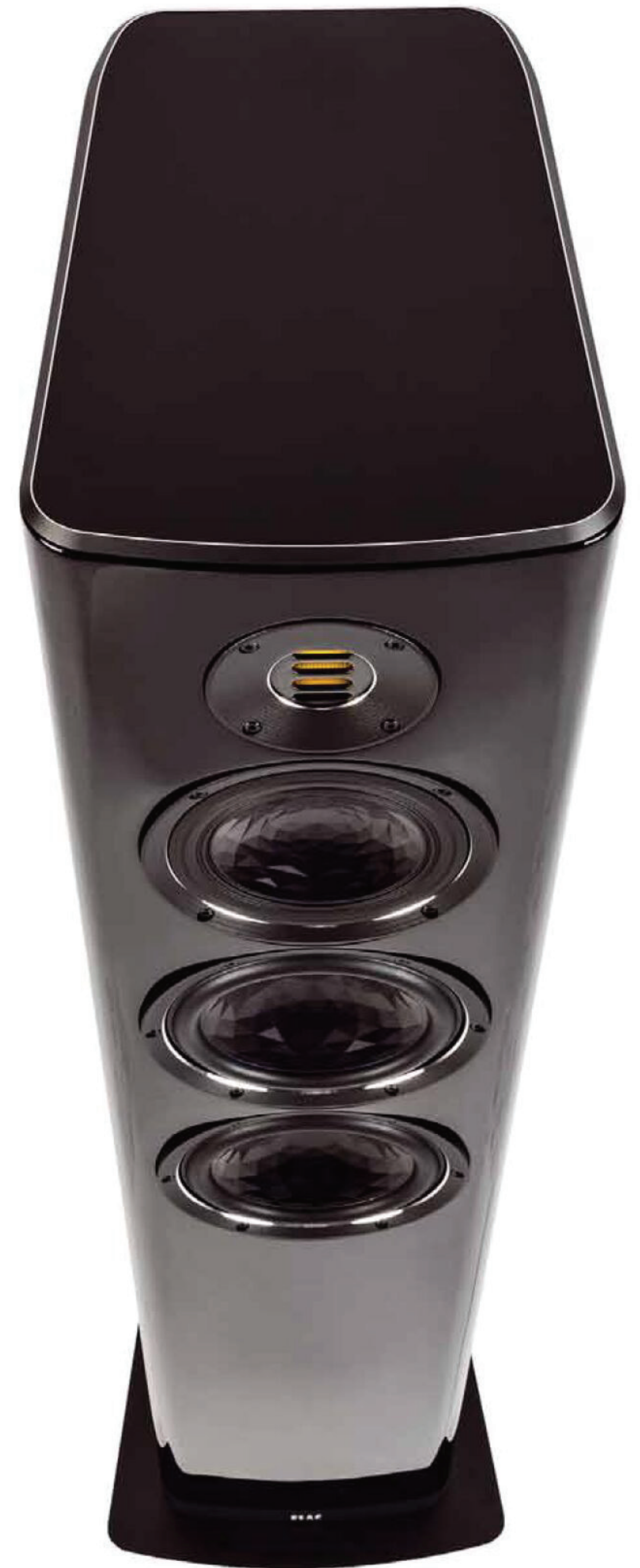
Die leicht trapezförmige Bauform vermindert Resonanzen durch stehende Wellen im Inneren des Gehäuses

Zurück zur FS 409: Die leicht nach hinten geneigte Box mit den hübsch gerundeten Formen versammelt auf ihrer Front zwei Tieftöner, einen Mitteltöner und – natürlich – einen Jet-Hochtöner, also einen Air-Motion-Transformer, der ja seit langer Zeit eines der Hauptmerkmale der hochwertigen Elac-Boxen ist.