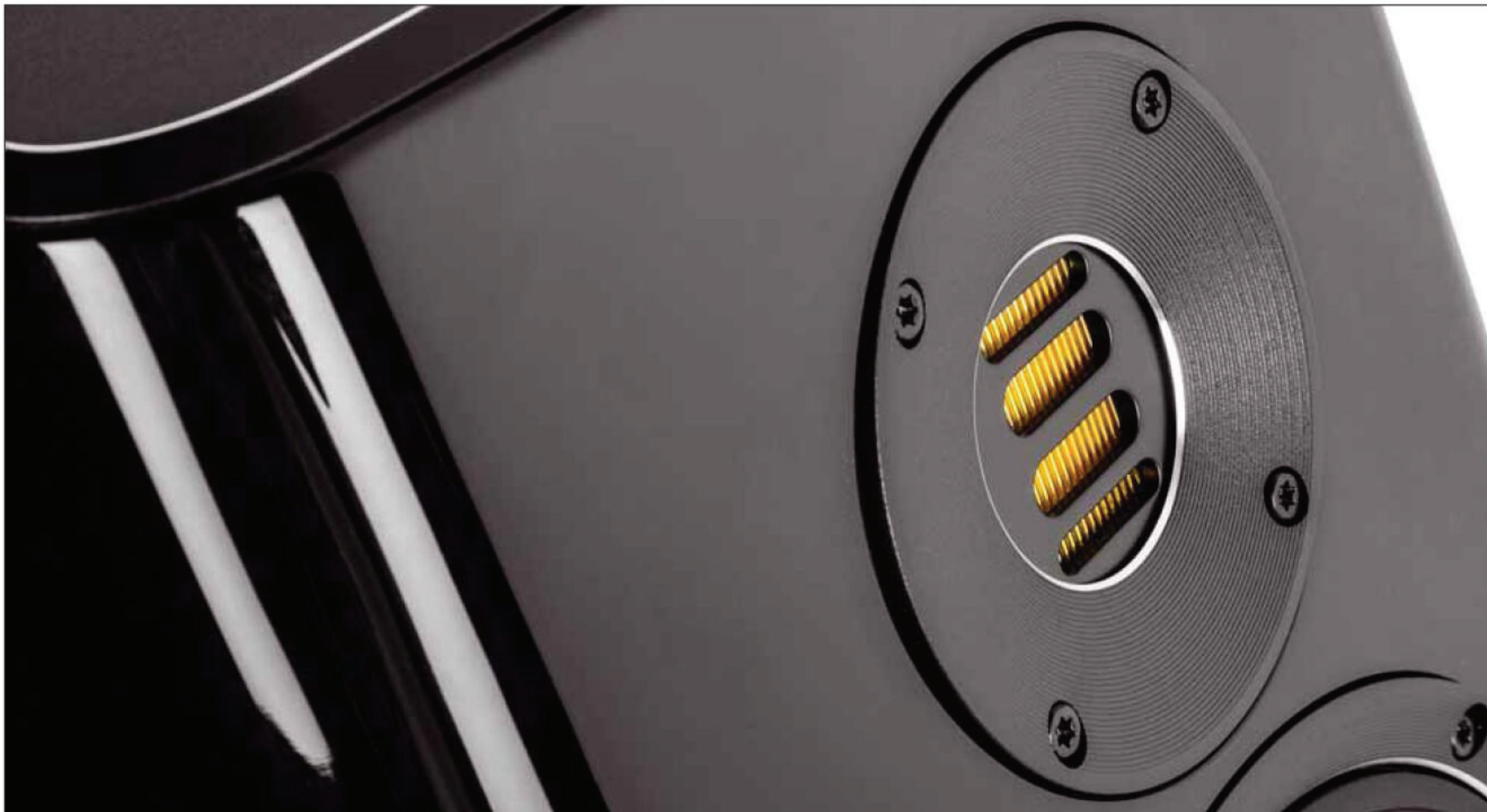
Seit Jahren ein Klassiker im Elac-Programm, hier mit einem neuen Waveguide: der Jet-Hochtöner

Audiogenuss in seiner elegantesten Form mit Echtholzgehäuse