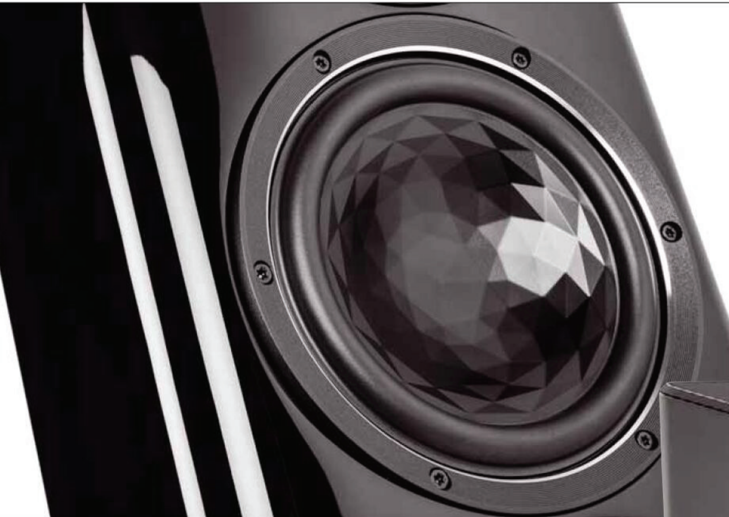
Tief- und Mitteltöner besitzen die von Elac entwickelte AS-XR-Membran