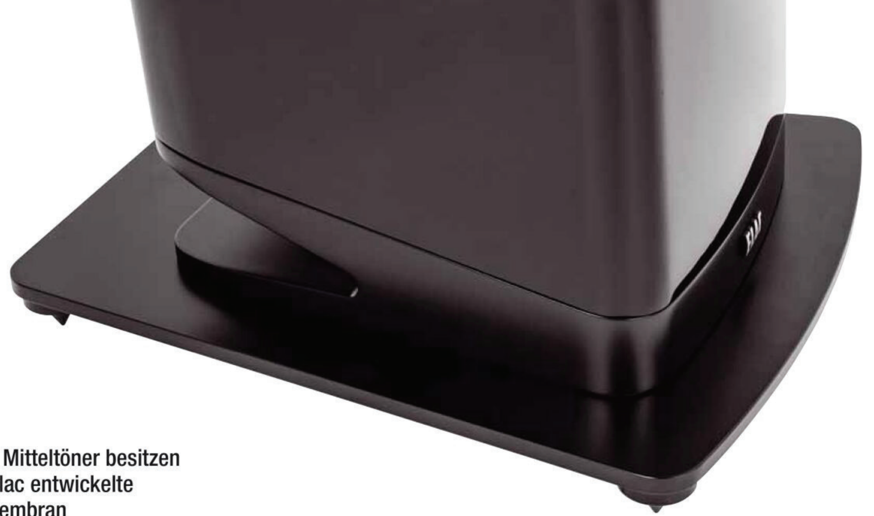
Auf den ersten Blick nicht zu erkennen: Der Sockel besteht aus Glas, in der Aussparung hinten mündet das Reflexrohr

Die Konustreiber haben die vor einigen Jahren eingeführte AS-XR „Facettenmembran“, ein Vollkonus in Sandwichbauweise mit geprägter Front, der die innere Stabilität der Membran erhöht und vor allem ihr Resonanzverhalten entschärft und so deutlich vereinfachte Filterschaltungen in der Frequenzweiche ermöglicht. Zwei 180-Millimeter-Tieftöner bearbeiten die ganz tiefen Frequenzen, wobei sie nur im Tiefbass parallel arbeiten. Der untere der beiden Bässe wird bereits bei 140 Hertz aus dem Rennen genommen, während der obere bei 360 Hertz an den Mitteltöner übergibt, ein weitgehend baugleiches Chassis mit 150 Millimetern Durchmesser. Bei 2700 Hertz steigt der Jet-Hochtöner ein. Der AMT hat einen neu desig-